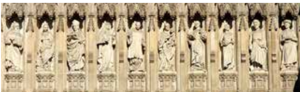
Eine Figur Bonhoeffers (4. von rechts) steht mit neun anderen Märtyrern des 20. Jahrhunderts über dem Westportal der Westminster Abbey in London.

Aber nun gilt auch das andere. Wo Christus im Schiff ist, da beginnt es immer zu stürmen. Da greift die Welt mit allen bösen Mächten nach ihm. Sie will ihn mit seinen Jüngern vernichten. Sie empört sich gegen ihn. [...] Kein Mensch muß durch so viel Angst und Furcht hindurch wie der Christ. Aber das darf ihn nicht verwundern. Denn Christus ist der Gekreuzigte und ungekreuzigt kommt kein Christ durchs Leben. So wird er es mit Christus zusammen leiden und durchmachen. Aber er wird immer auf den sehen, der mit ihm im Schiff [ist] und alsbald aufstehen kann und das Meer bedrohen, dass es ganz still wird.“